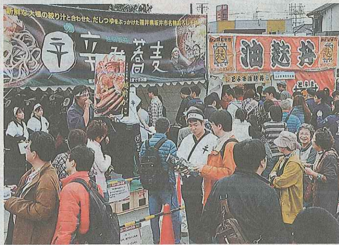
「越前坂井辛み蕎麦であなたの蕎麦で辛み隊」が 初出展したB-1グランプリ豊川大会=11月9 日、愛知県豊川市