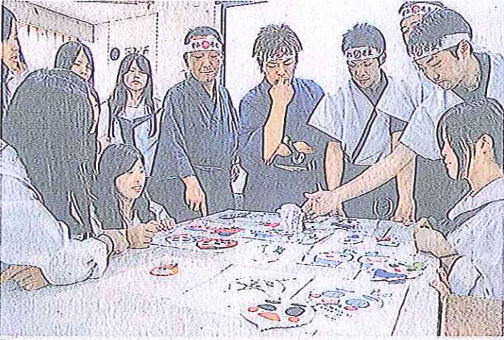
生徒たちが考えた坂井市PRグッズ(手前)について意見を交わす辛み蕎麦隊員ら(坂井市の三国高校で)

食を通じて坂井市の「あなたの蕎麦で辛みまちおこしに取り組み隊」は十六日、同市三「越前坂井辛み蕎麦で国町緑ヶ丘二丁目の三PRグッズの審査会を開いた。