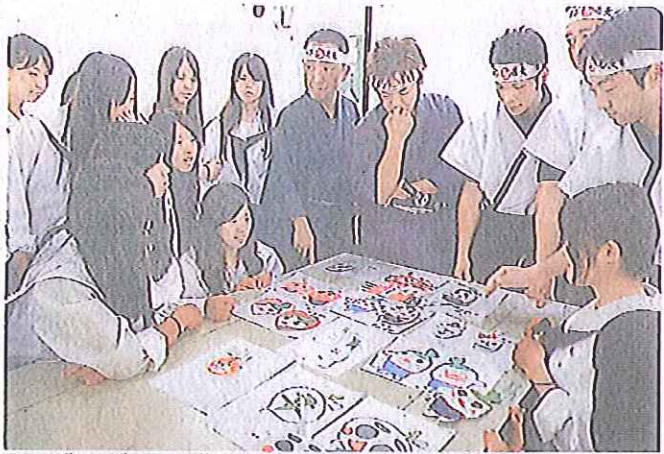
グッズのデザインについて意見を交わす生徒と辛み隊のメンバー＝16日、坂井市の三国高

坂井市の三国高家政科の3年生が、同市の「当地グルメ」越前坂井「辛み蕎麦」をPRする団体「あなたの蕎麦で辛み隊」の依頼で、同市のPRグッズを製作することになった。考案したデザイン 16日、同校で行われた。今後、生徒たちがデザインを基にフェルト生地で330個を製作。全国の「当地グルメ」が集う「B-1GP」の会場「出展する。辛み隊は、待ち時間も