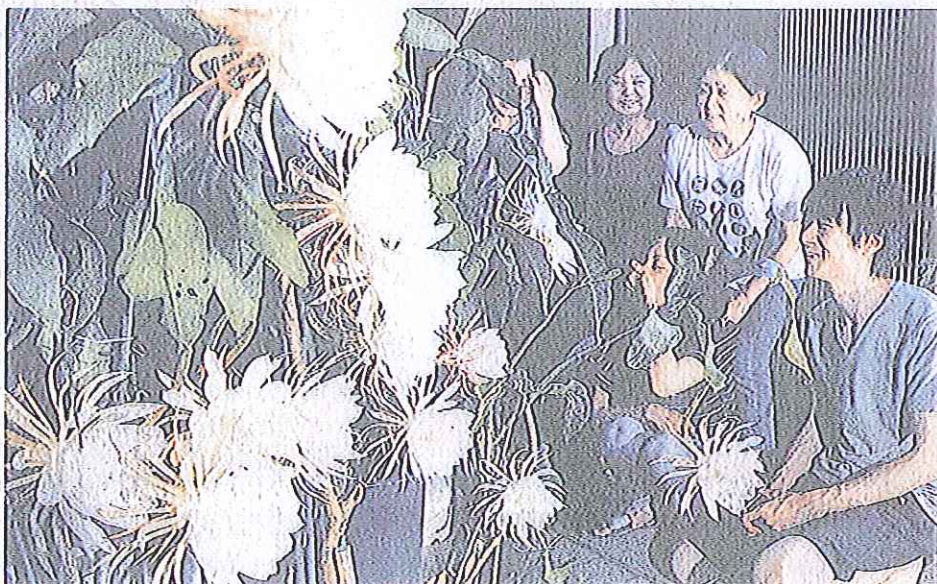
満開に咲き誇る月下美人を眺める近所の人たち=福井市中野2丁目

散り、見知らぬ男と連絡相手の名前や電話番号を取ったため、小学生を知らなくても、「友だち」として連絡を取ることができ、機能が