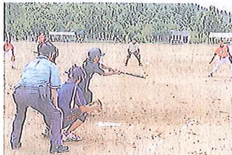
白熱した攻防を繰り広げたウイングクラブ＝あわら市のトリムパークカ

あわら 県内外17チーム交流 県内外の知的障害者に よるソフトボール大会「第34回ウイングクラブ」(福井新聞社後援)が13、14の両日、あわら市のトリムパークかなで開かれた。選手たちは懸命に白球を追いかけるながら親交を深めた。 福井市のNPO法人「福祉ネットこうえん会」が毎年夏を秋に開いている。今大会には県内をはじめ石川、富山、兵庫、奈良から17チーム約240人が参加。レベル別に3グループに分かれ、トーナメント戦で争った。 ウイングクラブはあわら市のトリムパークカで、ソフトボールの試合が行われた。選手たちは懸命に白球を追いかけるながら親交を深めた。