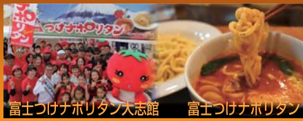
富士つけナホリタン大志館