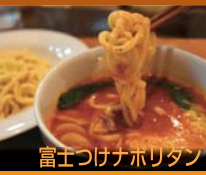
富士つけナホリタン