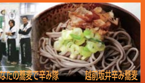
越前坂井辛み高麦