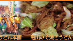
亀山みそ焼うどん