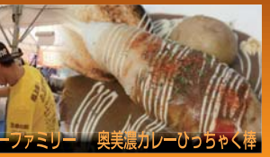
奥美濃カレーフひっちゃく棒