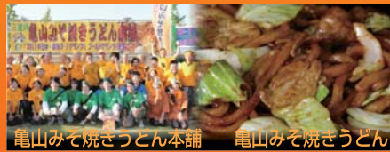
亀山みそ焼うどん本舗