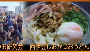
西伊豆しおかつうどん