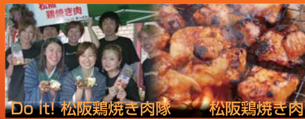
Do it! 松阪鶏焼き肉隊