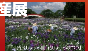
賀茂しょうぶ園「花しょうぶまつり」

「ほの国」東三河が、おもしろい! 美味しい「コト」と「モノ」を揃えて、 みなさんのご来場をお待ちして おります!