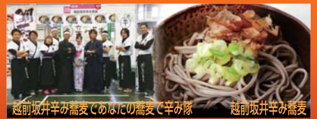
越前坂井辛み高麦てのぼりの高麦て辛み隊