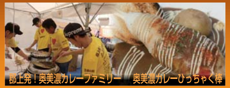
部上発!奥美濃カレーフAMILY