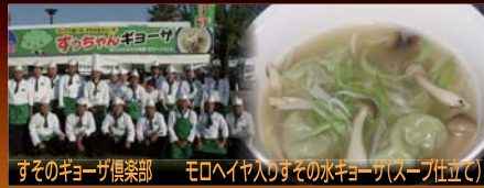
すそのきょうが倶楽部