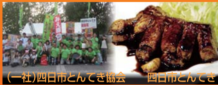
(一社)四日市とんてき協会

※出展の各ご当地グルメは、イベント専用チケット「たべりんくうポン券」にて販売します。