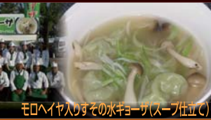
モロヘイヤ入りすそのきょうが(スープ位立)