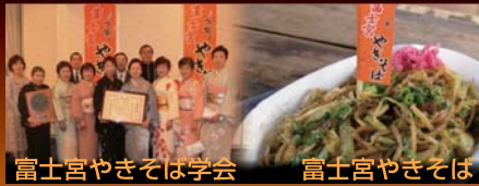
富士宮やきそば学会