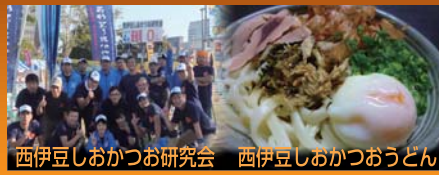
西伊豆しおかつお研究会